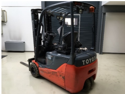
Toyota Traigo 8FBET18