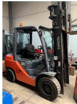
Toyota Tonero 3t