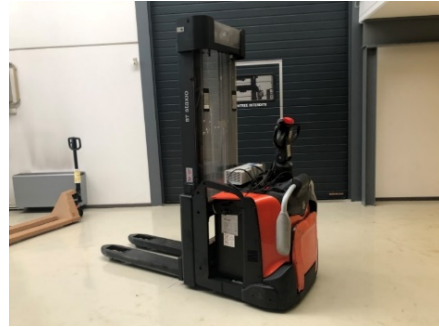
Toyota Staxio SPE140L